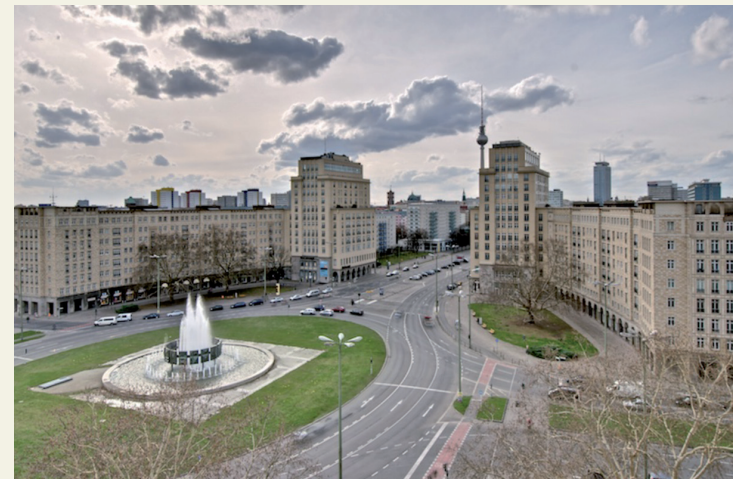
Straußberger Platz, Friedrichshain, Berlin Selektion 01