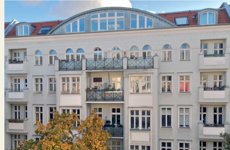
Knobelsdorffstraße, Charlottenburg, Berlin Selektion 01